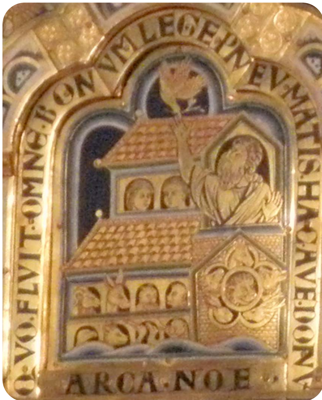
DIE ARCHE NOAH VON NIKOLAUS VON VERDUN KLOSTERNEUBURGER ALTAR, 1181