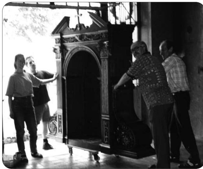
Räumung der Kapelle im Sommer 1999